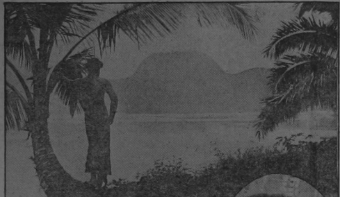
Paisaje de la isla de Norfolk, en los mares del Sur, con magníficas bahías de espléndida belleza natural, donde se desarrolló la raza objeto del presente artículo.

ción "ánica" pareció desarrollarse en el ex-marinero inglés, la responsabilidad moral elevada al cubo, y oficiando de Patriarca, no le hizo del todo mal, administrando la población cuerda y sabiamente.