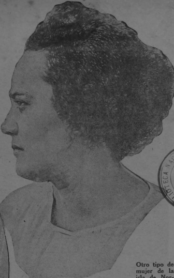
Otro tipo de mujer de Norfolk, en cuyo rostro se registran, más acentuados, los rasgos propios de los Tahitianos.

"Como ejemplo social de la mezcla entre dos razas—dice Shapiro—resulta el pueblo de Norfolk único en el mundo que se haya visto libre, de las influencias degradantes que figuran tan prominentemente en la historia de ésta clase de conglomerados. Y si se añade, que el ancestralismo, no deja lugar al menor género de duda, respecto a su probable origen—amotinados ingleses y mujeres tahitianas indígenas—con un continuo casorio entre sí, durante más de cinco generaciones—el "caso" se convierte en uno de los más "interesantes" que puedan ofrecerse a la investigación de la Ciencia."