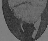
"El Tio Cornish" que ayudó, grandemente, al antropólogo Shapero en su estudio de los isleños de Norfolk.