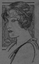
Gloria Swanson in the Paramount Picture "Bluebeard's 8th Wife"

El estreno de esta noche en el Moderno comprende una exhibición bellísima de lujosos trajes de última moda que han costado 250 mil dólares.