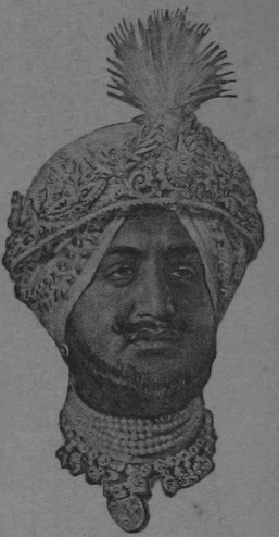
El Rajha de Petiola, portando joyas valuadas en $3,000,000. Los potentados orientales, són célebres por su lujo y afición a las alhajas, que se encargan de proporcionarles los joyeros de París y Londres. Alguna vez, también les dan disgustos los aficionados a su dinero, como recientemente hubo de ocurrir en Londres, a otro potentado de India.

Infinidad de tretas, más ó ménos ingeniosas, podrían adhirse a la lista, pero por lo expuesto verá el lector que no todo son delicias en el comercio de joyas, esas baratijas, que por lo general hacen las delicias de las mujeres, y tantas veces, la desgracia de los hombres!