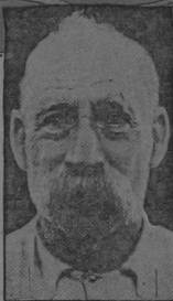
Iseños típicos, descendientes actuales de los amotinados del "Bounty," robustos sin tara alguna ancestral, y muy inteligentes.

El Capitán y sus fieles, fueron dominados por los sublevados, que les colocaron en un bote abandonándose a su suerte, en alta mar. Tras de infinitas penadillas, sin cuento, lograron salvarse yendo a dar a Timor, en el archipiélago Malayo. A bordo del "Bounty" asumió el mando Fletcher Christian, primer Contramaestre y jefe de la sedición. Su primer procedimiento—cómo es lógico—fué la de volver pro a Tahiti donde arribó con veintidós amo-