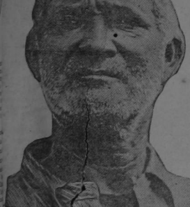
Otra vez figue de isleño de la generación actual, y la que resulta imposible descubrir el menor síntoma de degeneración racial.

¿Qué prueba todo ello? Poca cosa, que pese a todas las teorías de la degeneración y demás zarandajas antropológicas, el aislamiento en una isla tropical y desierta, atendidos a los propios recursos y excelencias de la vida natural, pueden, y lo han hecho, regenerar el milagro de regenerar y mejorar una población de plebeyos sus padres antecesores del mundo. Todo lo que para ello se necesitó, es soledad, y ninguna—por lo menos—muy poca, intervención de eso que llamamos "vida civilizada."